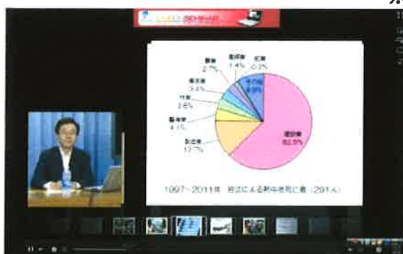
Live On Seminar イメージ画像

※質疑応答の時間を設けておりますが、システムの関係上全ての質問にお答えできない場合がございます。ご了承下さい。