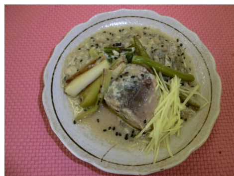
さばの缶詰でミルク煮