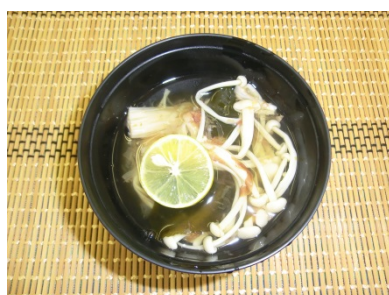
かつおときのこのすまし汁